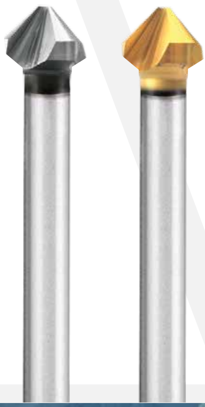
6274 | \varnothing 6,30÷30 mm 6274TN | \varnothing 6,30÷30 mm

Kegelsenker für eine hohe Leistung. Durch die unregelmäßige Teilung der Schneiden verringern sich die Axialkräfte und die Vibrationen. Dadurch können höhere Schnittdaten gefahren werden. Insgesamt erhöht sich die Werkzeugstandzeit, die Oberflächenqualität wird sehr gut und die Zykluszeiten reduzieren sich. Verfügbar von \varnothing 6,3 mm bis \varnothing 30,0 mm in der TiN beschichteten Version sowie ohne Beschichtung. Aufgrund der speziellen Merkmale ist dieses Werkzeug für eine breite Palette von Materialien geeignet.